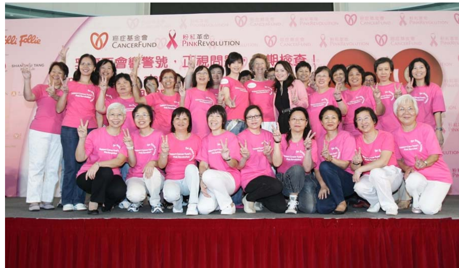
參與2007年香港癌症基金會『粉紅革命』活動