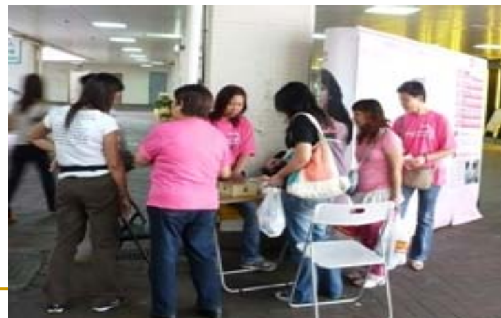
屯門良景商場地區展覽