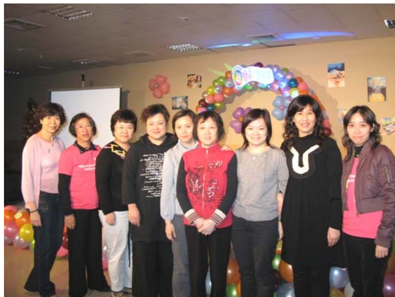
出席台中『第二屆全球華人乳癌組織聯盟大會』