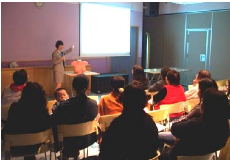
『你的健乳美』公眾教育推廣計劃